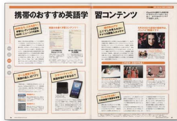
携帯のおすすめ英語学習コンテンツ [2010年7月号] ワンセグやスマートフォンなど、モバイル機器を使用した最新英語学習法を徹底解剖。