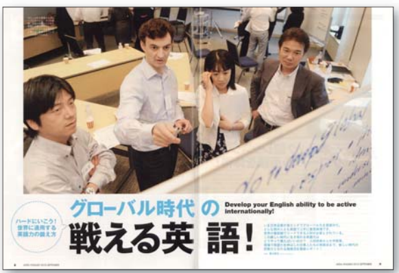
グローバル時代の戦える英語! [2010年9月号] 世界に通用する英語力をグローバル企業がどのように身につけようと努力しているのか、勉強方法や通っている教室などを紹介。