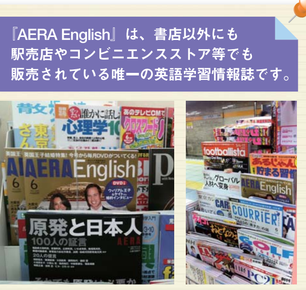
『AERA English』は、書店以外にも販売されている唯一の英語学習情報誌です。