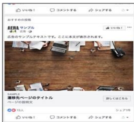
Facebook 広告配信イメージ