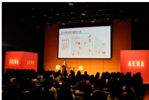
第7回「ワーキングウーマンのための新ライフマネジメント論」の様子

働く女性を応援するイベント「ワーキングウーマンのための新ライフマネジメント論」を開催しています。