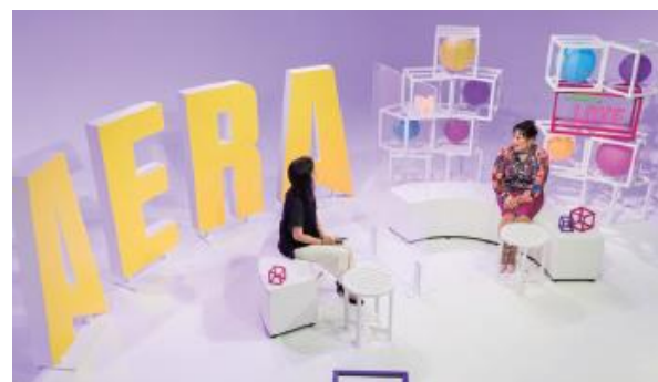
第11回 オンラインイベントの様子