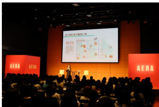
第7回「ワーキングウーマンのための新ライフマネジメント論」の様子

誌面以外にも、働く女性のためのイベント「ワーキングウーマンのための新ライフマネジメント論」を開催してきました。