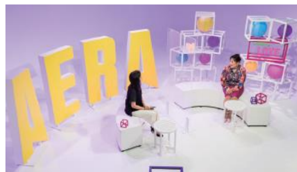
第11回 オンラインイベントの様子